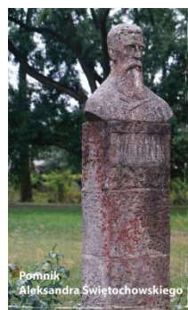
Pomnik Aleksandra Świętochowskiego

Zadanie zrealizowano dzięki dofinansowaniu ze środków Samorządu Województwa Mazowieckiego oraz środków Ministra Kultury i Dziedzictwa Narodowego pochodzących z Funduszu Promocji.