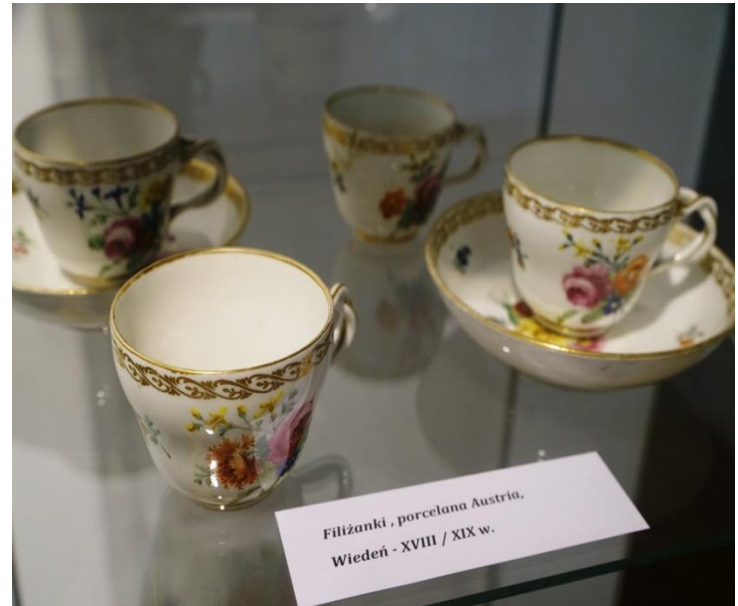
Filiżanki, porcelana Austria, Wiedeń - XVIII / XIX w.

Wystawa była czynna w Muzeum Szlachty Mazowieckiej w Ciechanowie od czerwca do listopada 2020 r. Kurator: Elżbieta Długołęcka. Porcelana uchodzi za jeden z najszlachetniejszych materiałów ceramicznych, to wyjątkowy element dekoracyjny który przyciąga pięknem, wspaniałym detalem i oryginalną malaturą. Na wystawie zaprezentowanych zostało ponad 100 porcelanowych eksponatów pochodzących z XIX i XX wieku. Eksponaty ze zbiorów Muzeum Szlachty Mazowieckiej w Ciechanowie, a także prywatnych kolekcji.